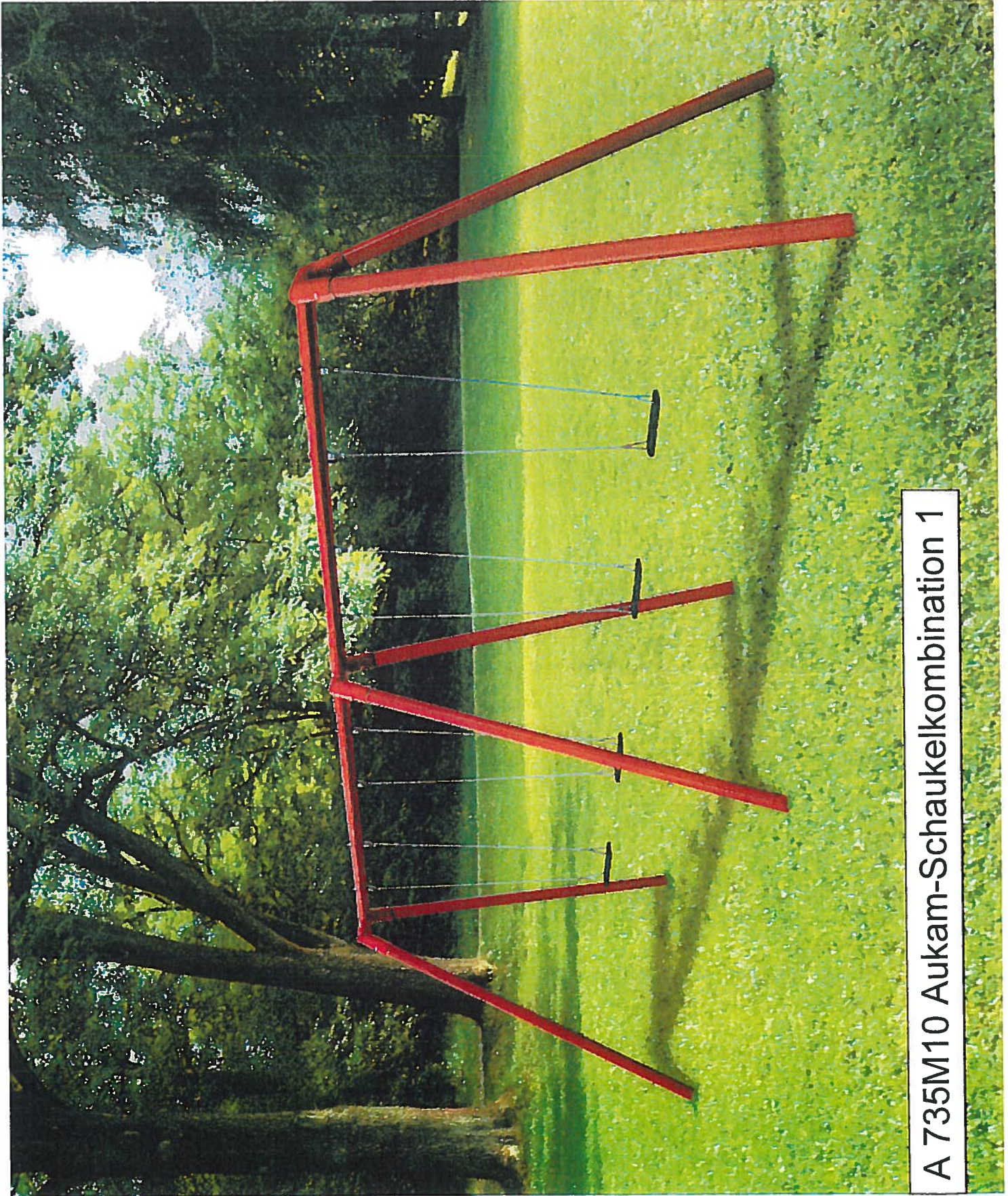
A 735M10 Aukam-Schaukelkombination 1